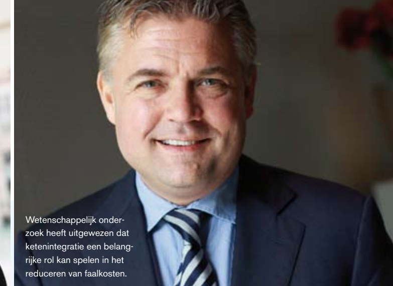
Wetenschappelijk onderzoek heeft uitgewezen dat ketenintegratie een belangrijke rol kan spelen in het reduceren van faalkosten.